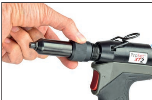
Szybkie odłączanie obudowy głowicy przedniej i szczęk (bez użycia narzędzi)