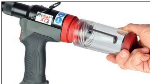
Szybko odłączany układ kolektora trzpieni (MCS)

Rodzina narzędzi POP Avdel ProSet® XT oferuje wiele innowacyjnych funkcji zwiększających wydajność, jak szybko odłączana obudowa głowicy przedniej i obudowa szczęk, co pozwala na szybkie czyszczenie i konserwację końcówek bez potrzeby użycia żadnych narzędzi. Szybko odłączany układ kolektora trzpieni (MCS) bezpiecznie gromadzi zużyte trzpienie, pozwalając na ich szybką i łatwą utylizację oraz lepsze utrzymanie porządku w miejscu pracy. Przełącznik odcinania powietrza w MCS blokuje przepływ powietrza, gdy MCS jest odłączony. Obrotowe obustronne złącze pneumatyczne obracane o 90° pozwala dostosować narzędzie do praktycznie dowolnej konfiguracji stanowiska roboczego, a włącznik minimalizuje zużycie powietrza i hałas.